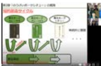
例）大阪府立豊芸高等学校