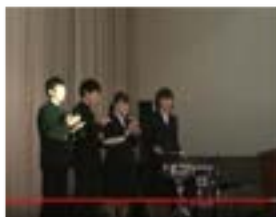
例）長崎県立長崎東高等学校