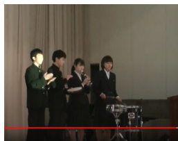
例) 長崎県立長崎東高等学校