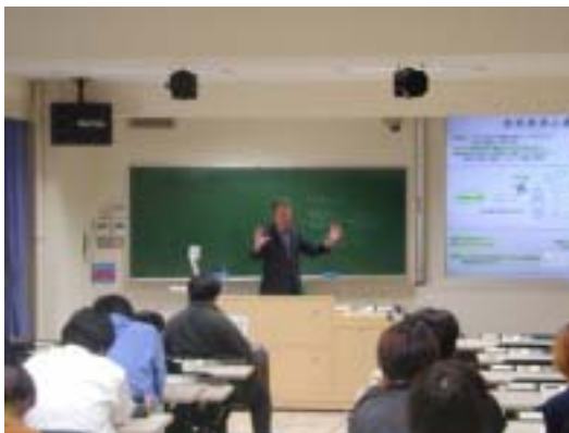
技術経営とベンチャー(松田)

「技術経営とベンチャー」 「エネルギー・環境技術と経済学」 「ベンチャー起業論」 「地域経済とベンチャービジネス」 「ベンチャービジネス特論」 「ベンチャービジネスと企業経営」