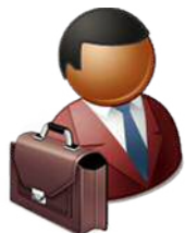
外部機関等担当者