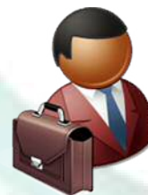
外部機関等担当者

共同研究経費は 直接経費 150万円 間接経費 15万円以上 計165万円以上でご検討いただけますか。