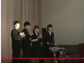
例) 長崎県立長崎東高等学校