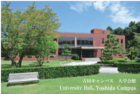
吉田キャンパス 大学会館 University Hall, Yoshida Campus