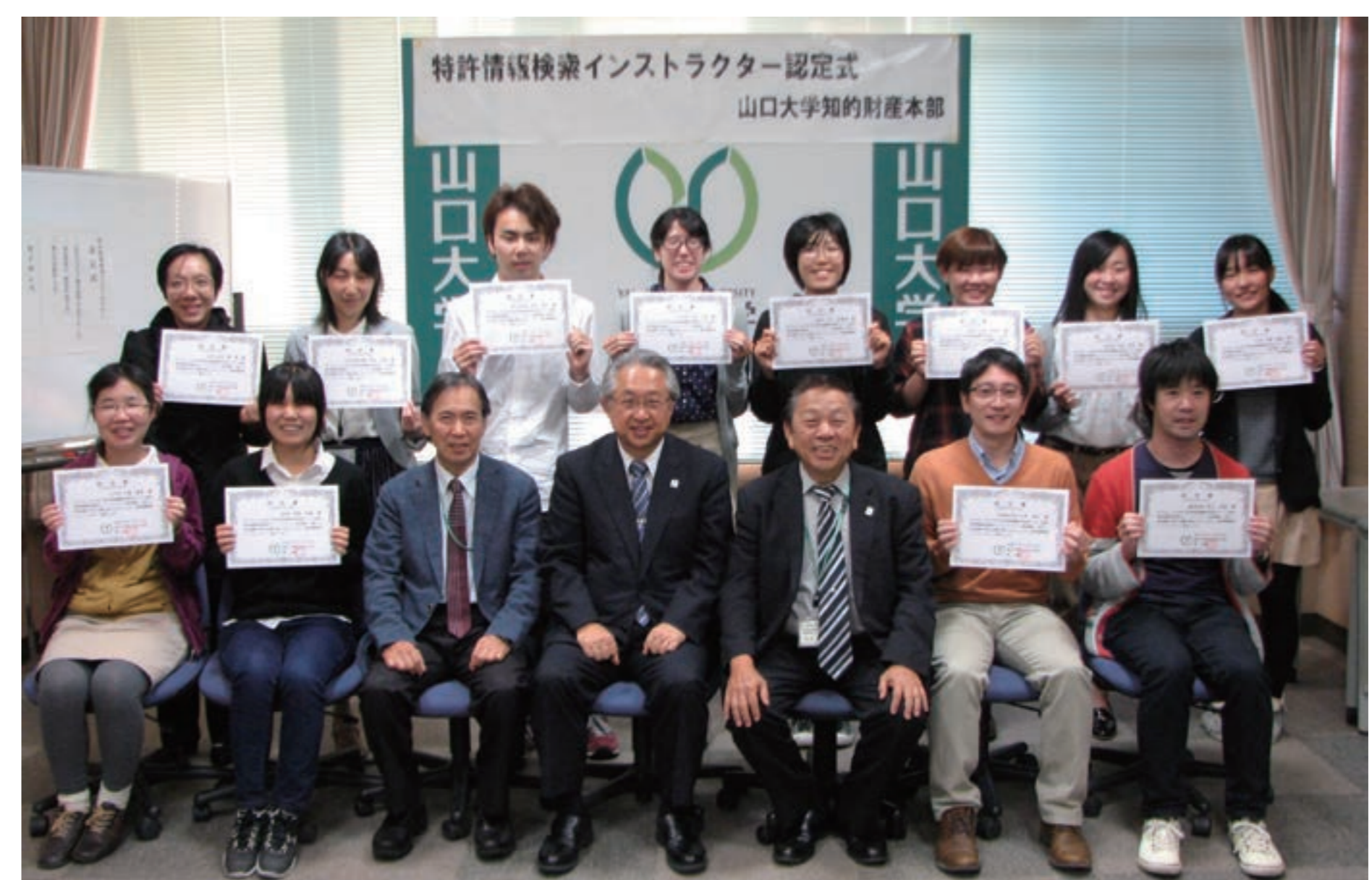
特許情報検索インストラクター認定式