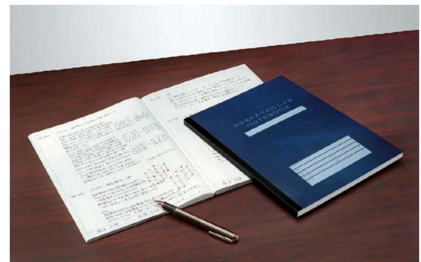
研究ノート「リサーチラボノート®」