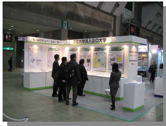
展示ブースの様子