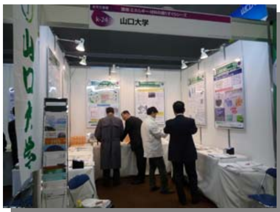
来場者に説明をするスタッフ