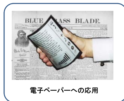
電子ペーパーへの応用